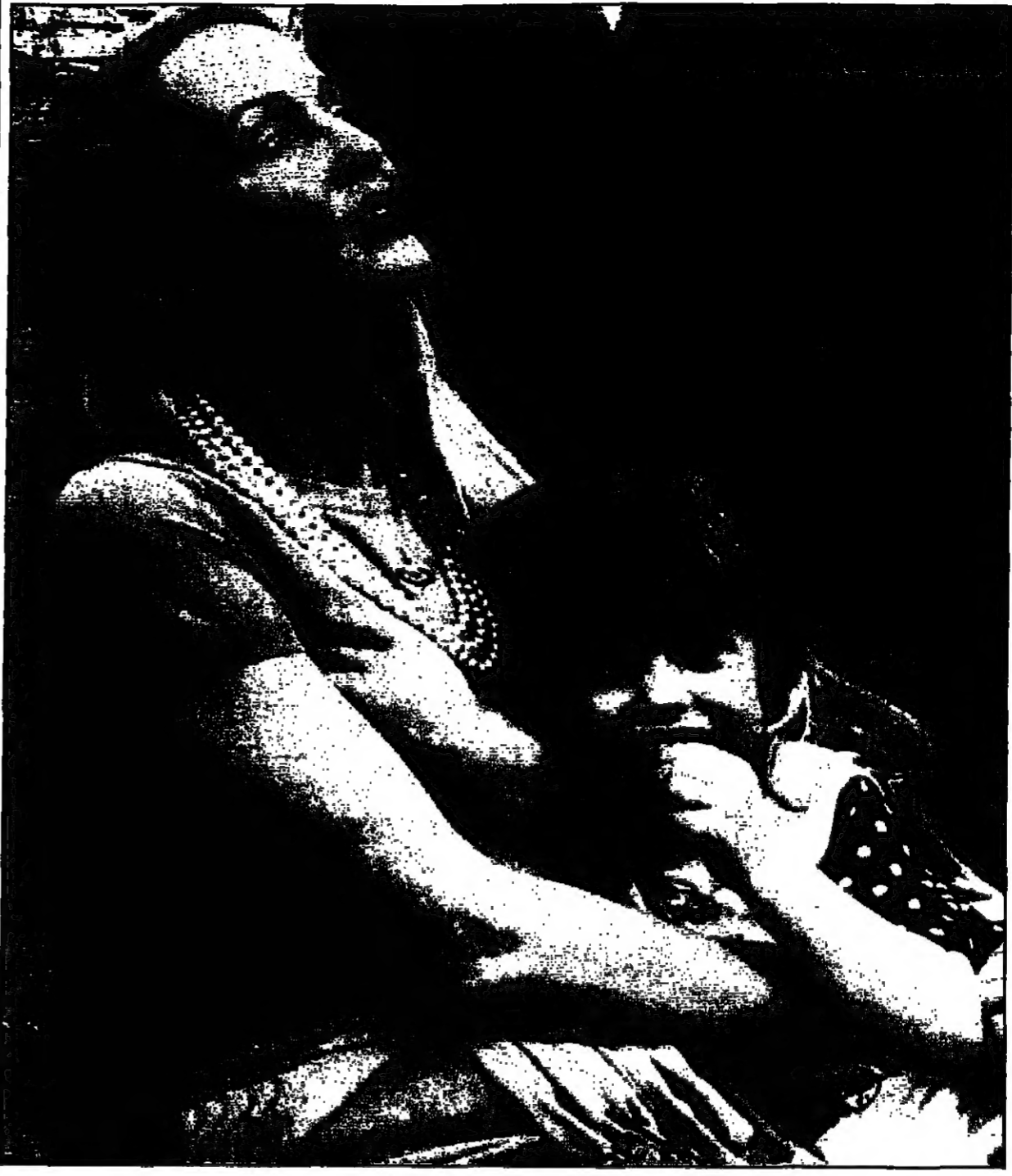
جيري هول وابنتها

ماذا تعطيني معكم عدا؟ نمضي سوية وقتنا طويلا نتجول في الحدائق، وبينما اهتم واعتني بالزهور يركض الازياء في ممرات الحدائق. وفي اثناء سلطة نهاية الاسبوع نتجول حول المنزل ونقود الدرجات الهوائية ونمارس رياضة الجري على العجلات. انني مولعة بوضع الحلوى وجورجيا ماي تتعلم العزف على الكمان والبرازيليات تحبون على البيانو فيما يعزف جيس على الغيتار. انني مصرة على تعليم الازياء العزف على الالات الموسيقية والازياء سياتسوفون على عدم تعلمهم في الصغر على العزف. ولهذا السبب فانني اصطحبهم معي الى الكنيسة. وهذا شيء مهم للاطفال ان يوطئوا ويتلقوا ثقافة دينية. وكيف تدير احوال الازياء مع ابيهم؟ الازياء يعيشون صعوبة الفراق الطويل عن ابيهم مارك، ولكي اعرض لهم من هذا الغياب احاول البقاء في المنزل قدر الامكان. في شهر ايلول (سبتمبر) للثلاث سيقوم مارك بجولة عالمية وهو شيء صعب للغاية للاطفال. ومايك يمضي وقتا طويلا معهم. انه يتصرف كاب حقيقي للعائلة.